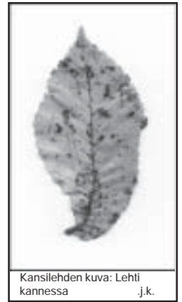
Kansilehden kuva: Lehti kannessa j.k.